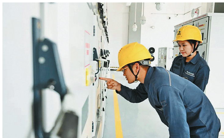
技术人员对35千伏机场变电站高压开关柜进行投运前检查

电局创新电力保障模式，组织输电、变电专业技术人员全程提供技术指导。在新建线路施工过程中，创新采用“现场施工+随工验收”的贴心服务模式，验收人员提前介入指导，有效减少因施工质量不过关、技术不达标而返工的情况，极大地缩短了施工和验收周期。针对红河蒙自机场项目的双电源供电需求，技术人员提前6个月参与规划，优化电网拓扑设计，构建起“双环网+智能设备自投”的供电网络架构，并通过部署智能监测终端，实现对供电设备的24小时在线监测。