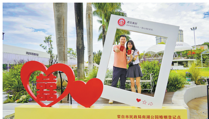
新人甜蜜打卡拍照。

借助登记热潮,全州民政部门同步开展婚姻法律法规普法宣传,普及反家暴、妇女权益保障等法律知识,让服务既有温情又有法治厚度。同时,不断健全婚姻家庭服务保障机制,构建婚前辅导、婚后调适、离婚调解的服务体系,帮助新人掌握婚姻经营技巧,从源头化解家庭纠纷,守护家庭幸福安稳。