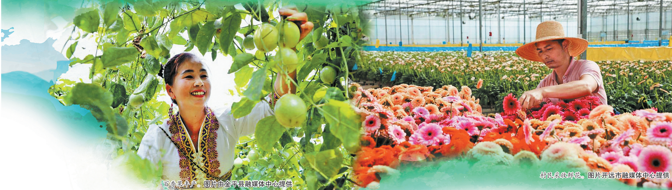
百香果丰产。