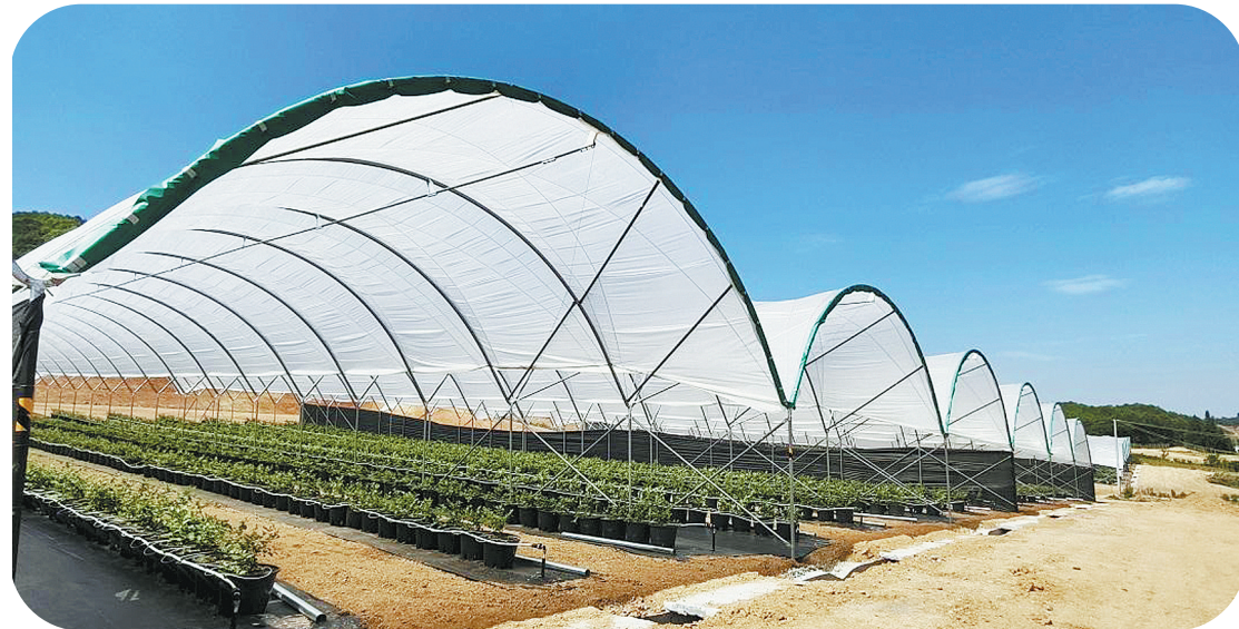
鸣鹭镇高山蓝莓基地。

过去，红河州地处热带和亚热带交界的复杂地形让农民“看天吃饭”，如今，科技的深度应用，让红河州的农业实现了生态效益与经济效益的同步跃升。红河州以“科技破题”，围绕蔬菜、水果、花卉等六大产业布局创新链，建成2个国家级农业科