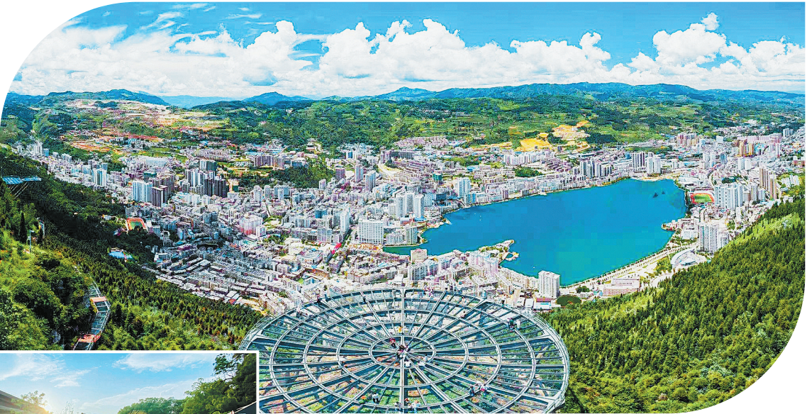
从阴山之巅俯瞰个旧城区。

从“锡都”到“小香港” 时光回溯至百年之前，地底沉睡的丰富锡矿被唤醒。矿灯如星，机械轰鸣。个旧因锡而兴，因锡而立，是世界上最早生产锡金属的地区之一，也是中国最大的产锡基地，是当之无愧的“锡都”。财富与机遇如锡脉奔涌，让这座山城焕发出令人目眩的活力。 高楼依山而建，灯火彻夜辉煌，繁华盛景比肩香江，“小香