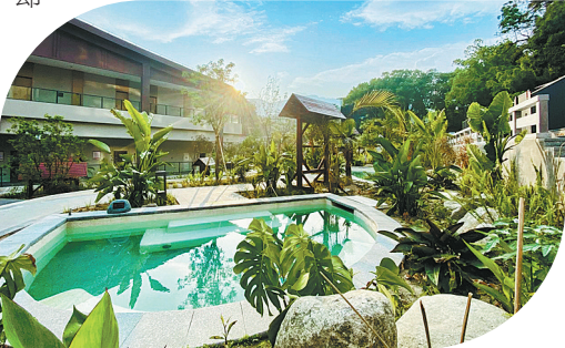
深藏于河谷的温泉。

从工业符号到生活美学 “个旧”二字，如今被赋予更多温情注解。在乍甸牛奶小镇，游客可亲手制作奶皮；在老阴山玻璃栈道，游客的身影与夕阳下的剪影构成独特风景。这座城市正以“旅居胜地”之名重构