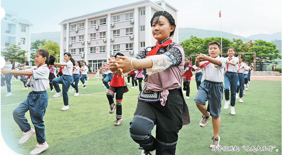
同学们跳起“哈尼大乐作”。