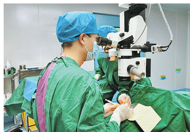
实施法瑞西单抗注射治疗